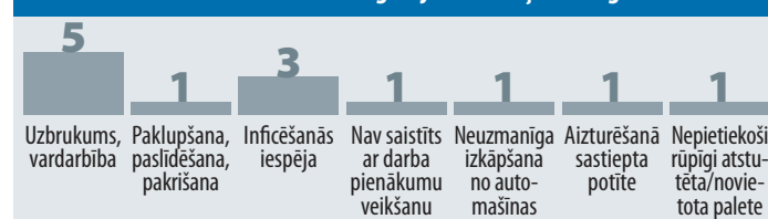
Grifs AG darbā notikušo nelaiemes gadījumu cēloņi 2014. gadā